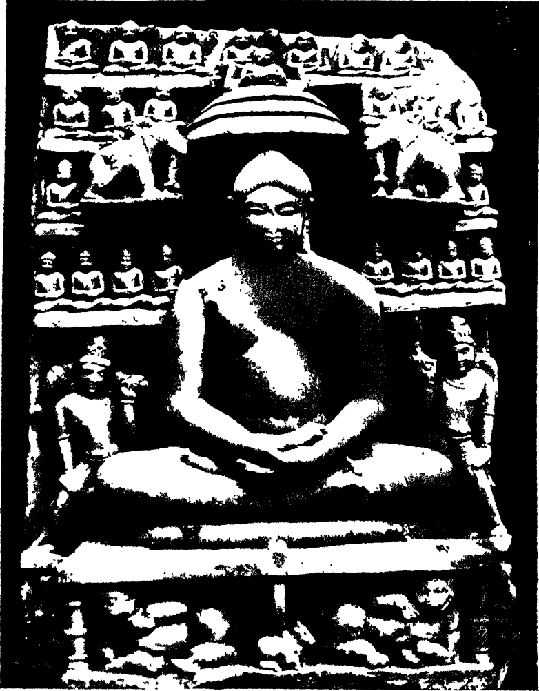
सोभनाथ मंदिर से प्राप्त ऋषभदेव की मूर्ति